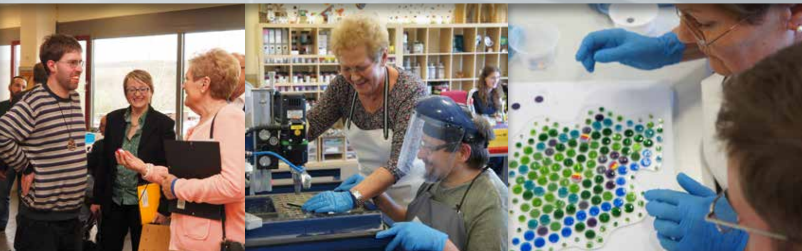
Die Einladung ...