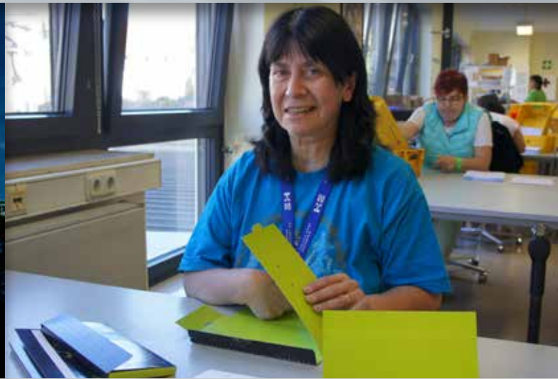
Konfektionierung der Bilfinger-Artikel.