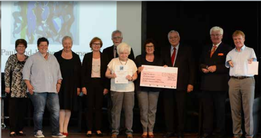
Preisverleihung Paul-und-Käthe-Kraemer-Inklusionspreis in Köln-Frechen.

durchdringende Verbesserungen im Sinne der UN-Behindertenrechtskonvention bewirken. Mehr als 200 Einsendungen gemeinnütziger Organisationen und Vereine, Initiativen, Bildungs- und Kultureinrichtungen erreichten die Stiftung. Eine Fachjury wählte dann aus allen Bewerbern vier herausragende Projekte aus, die in besonderer Weise dazu beitragen, dass Menschen mit und ohne Behinderung im Alltag zusammenfinden. Und bei den Feierlichkeiten anlässlich der Ehrungen im Mai bekam der Kulturschlüssel Saar vor rund 300 Gästen den dritten Preis überreicht, der zudem mit 3.500 Euro versehen war.