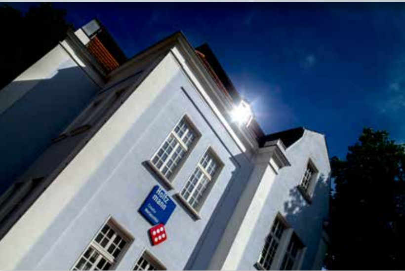
Stammsitz von Holtzmann Creativ.