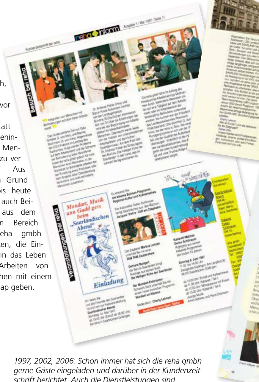
1997, 2002, 2006: Schon immer hat sich die reha gmbh gerne Gäste eingeladen und darüber in der Kundenzeitung berichtet. Auch die Dienstleistungen sind natürlich heute wie damals beliebte Themen.

Wunsch, die Scheu vor einer Werkstatt für behinderte Menschen zu verlieren.“ Aus diesem Grund sind bis heute immer auch Beiträge aus dem sozialen Bereich der reha gmbh enthalten, die Einblicke in das Leben und Arbeiten von Menschen mit einem Handicap geben.