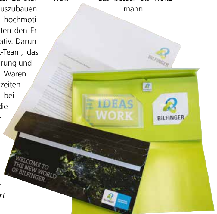
Diese Box wurde bei der reha gmbh konfektioniert und verschickt.