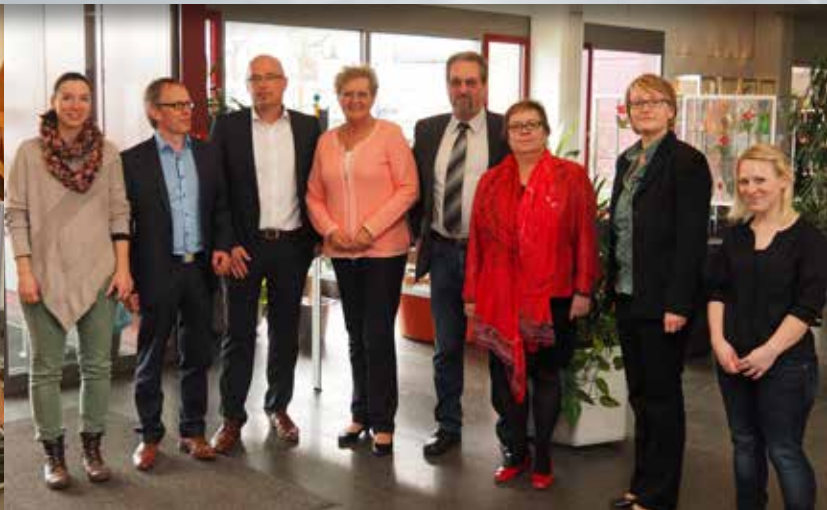
Im CAP-Markt in Sulzbach und im LogistikCenter der reha gmbh machte die Ministerin Station.